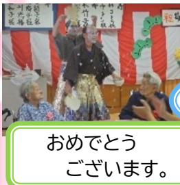
おめでとう ございます。