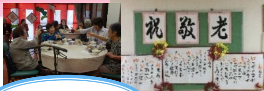
こがん祝ってもらって うれしか〜!