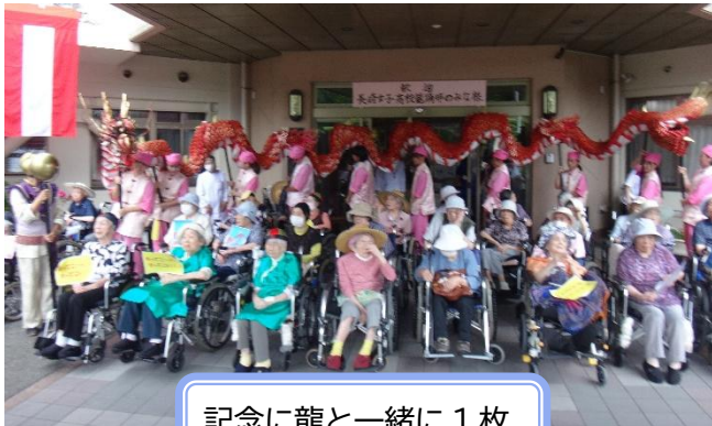
記念に龍と一緒に1枚