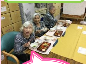
松花堂弁当 おいしかよ〜