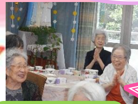
敬老の日に福の神 現る!!