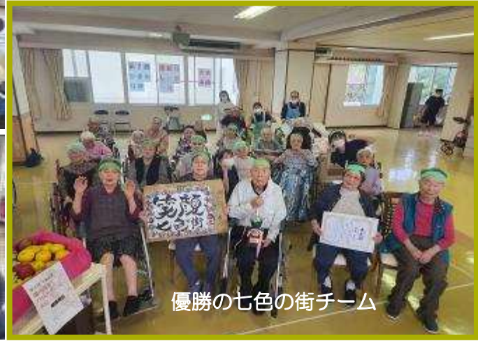
優勝の七色の街チーム