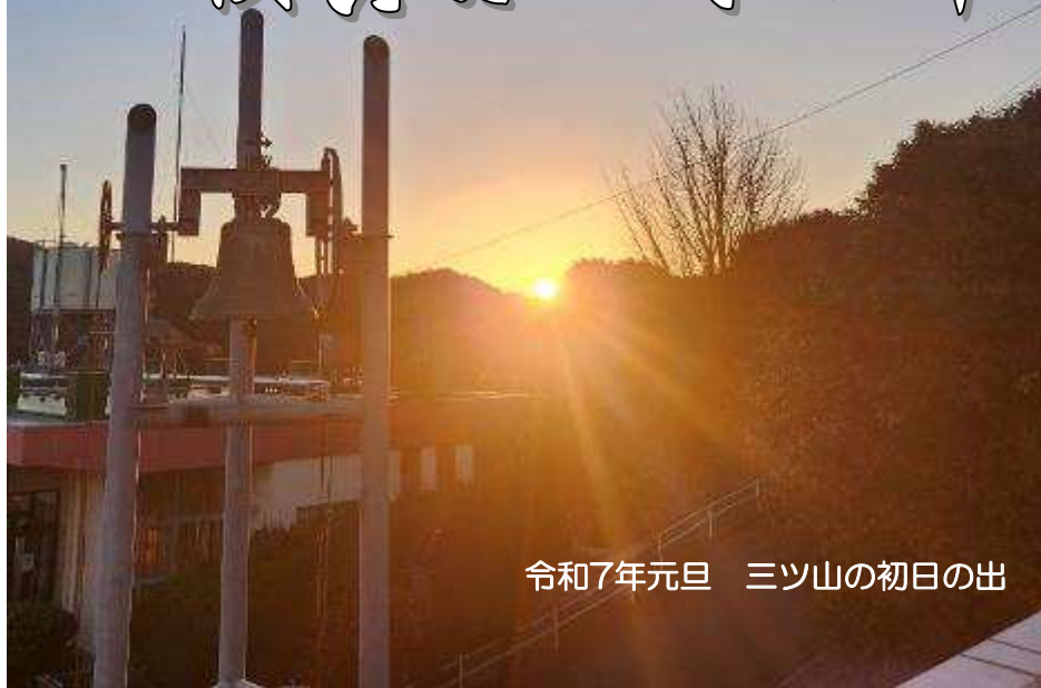
令和7年元旦 三ツ山の初日の出