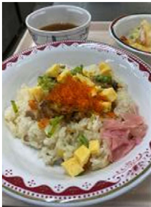
ひな祭り ちらし寿司