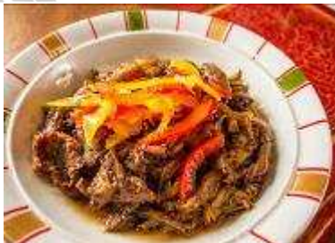
牛肉とキノコの炒め物