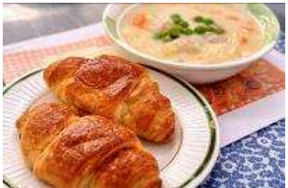
クリームシチューとクロワッサン