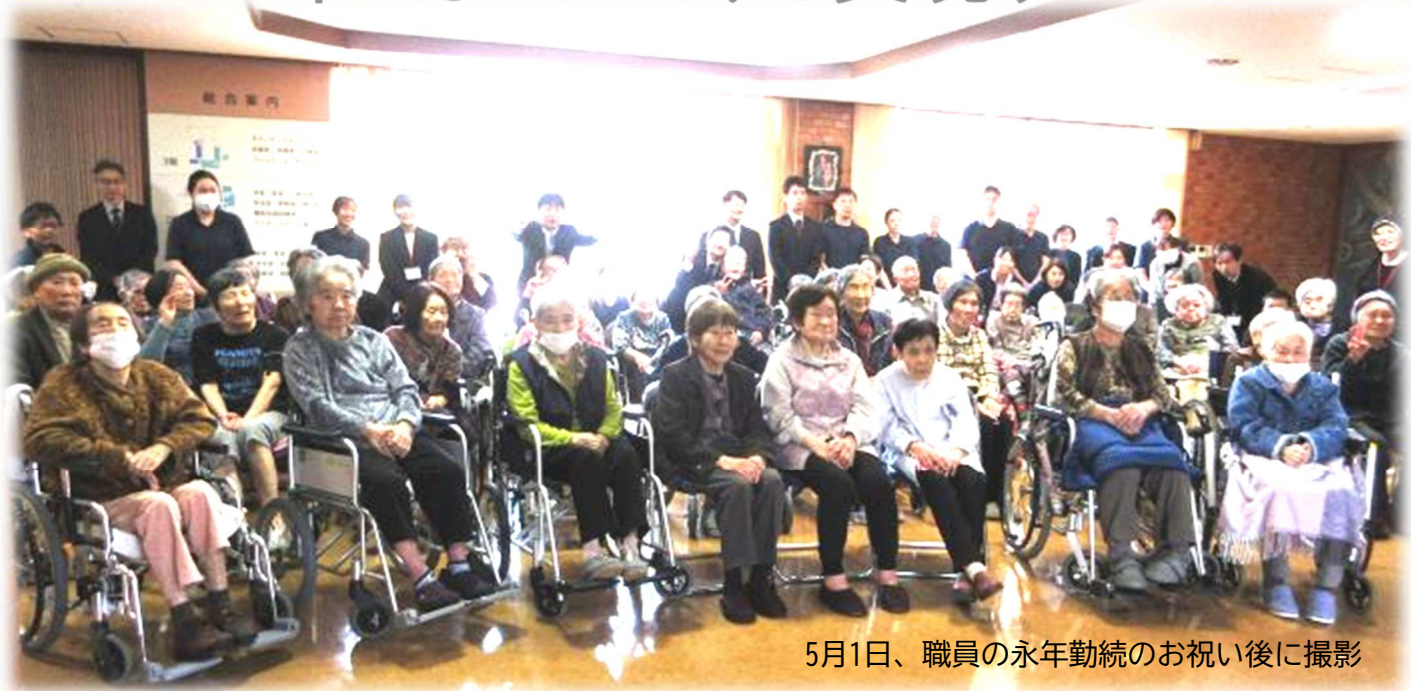
5月1日、職員の永年勤続のお祝い後に撮影